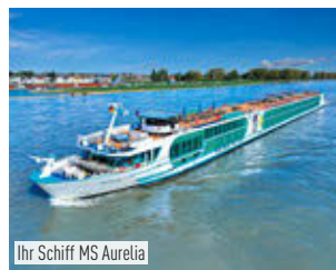
Ihr Schiff MS Aurelia